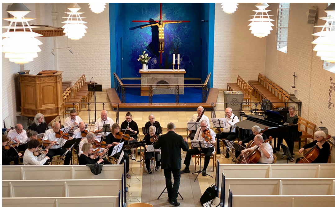
Koncert i Hasseris Kirke med Hobro Kammerorkester.

Hobro Kammerorkester er startet i 1982. Orkesteret spiller lettere klassisk musik fra barokmusik til nyere klassisk musik. Det har gennem årene bl.a. lavet en lang række kirkekoncerter, koncerter på Mariagerfjord Gymnasium, på Værket i Randers og været på flere orkesterrejser til udlandet. Der har været et betydeligt samarbejde med kor og solister. Indenfor det sidste år har orkesteret fejret sit 40 års jubilæum med koncerter på Mariagerfjord Gymnasium og i Sct. Mortens Kirke i Randers. Der blev bl.a. opført Schuberts smukke messe i G-dur sammen med kor og solister.